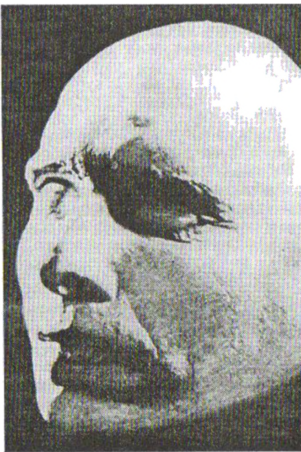
Посмертна маска Степана Бандери

боротьби Добра і Зла, яким є буття Української Нації. Коли одні провідники суспільства задля власних корисливих інтересів зраджували інтереси національні, — а народ за цей гріх національної зради розпачувався асиміляцією і голодоморами, кращі сини й дочки нації повинні були відкупити цей гріх своїм життям. „На нашій крові буде збудована Українська Держава“, — це послання Головного Командира УПА Романа Шухевича є простим і зрозумілим поясненням безстрашної боротьби усіх бандерівців в обставинах, які багатьом, хто сповідував матеріялістичний світогляд, здавалися безнадійними, а сама боротьба в таких умовах — безглуздою. Степан Бандера переміг у своїй боротьбі, бо правильним є його переконання і послання до нас: „Проби смерти не витримує те, що є витвором самого життя. А оце мільйони людей, цілі народи в обличчі смерти захищають правди і цінності, які їм дорожчі від самого життя! Бо людська душа походить від Того, Хто споконвіку був перед життям і буде після життя, вічно, а оборона великих правд більше наближає людську душу до Бога, ніж життя“.