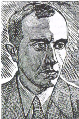
СТЕПАН БАНДЕРА ПРОВІДНИК ОУН

Тому зламатися Бандера не міг, хоча так само „ні просьби, ні грозби, ні тортури ані смерть“ не повинні були зламати кожного члена ОУН, які складали присягу на вірність українській справі на Тризубові, Святому Письмі а дехто ще й на зброї. Хоча і де-юре, і де-факто Бандера від моменту арешту перестав керувати Організацією, він залишався прапором, на який рівнялись усі учасники боротьби. Українці поширювали листівки з його фотографіями чи графікою члена Варшавської Академії Мистецтв Ніла Хасевича, в німецьких документах термін „Бандерагеверунг“ стає таким же звичним, як і термін „Бандерівщина“ в повоєнних радянських газетах. Тому, якщо ми говоримо про усвідомлення кожним членом ОУН своєї місії у житті власному і свого народу, то з такою ж міркою оцінки вчинків ми повинні підходити і до особи Провідника, на якого рівнялись тисячі членів ОУН, беручи його поведінку за зразок у найскрутніших життєвих обставинах. Можна з певністю сказати, що цю сторону місії Провідника Степан Бандера усвідомив уже на Варшавському процесі, отож і під гестапівським арештом, як справжній командир, не зробив нічого такого, що могло б зневірити його армію, навпаки, був прикладом для своїх послідовників. Історичні обставини Другої світової війни не залишили Степанові Бандері вибору – так само, як і