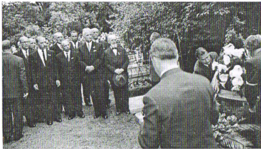
У 20-річчя смерті Євгена Коновальця на кладовищі Кросвік в Роттердамі. Перший ряд справа наліво: генерал М. Капустянський (з капелюхом), А. Мельник, С. Бандера, С. Ленкавський.

Важливим моментом регулювання відносин між українськими еміграційними угрупованнями є теза, що „... ставлення (до інших груп) мусить бути завжди таке, щоб не виходило з цього вказування на те, яких чинників немає в тій боротьбі. Бо не про те йде, і це ні до чого не доводить. Треба остерігатися такого тону, який викликає враження, що хочеться за кордоном монополізувати право працювати на користь боротьби на рідних землях або капіталізувати ту боротьбу для групових цілей“. Справа в тому, що після війни лише бандерівці мали широку підпільну мережу в ССРСР. Це було серйозним аргументом в політичній боротьбі на еміграції. Протиставлення на цьому ґрунті ставило під сумнів успіх консолідації еміграційних угруповань. Пізніше історик і публіцист Мірчук скаржився, що саме Бандера не дозволив публікацію антимельниківських праць у повоєнний