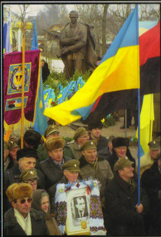
Відзначення 90-річчя з дня народження Степана Бандери в Старому Угринові