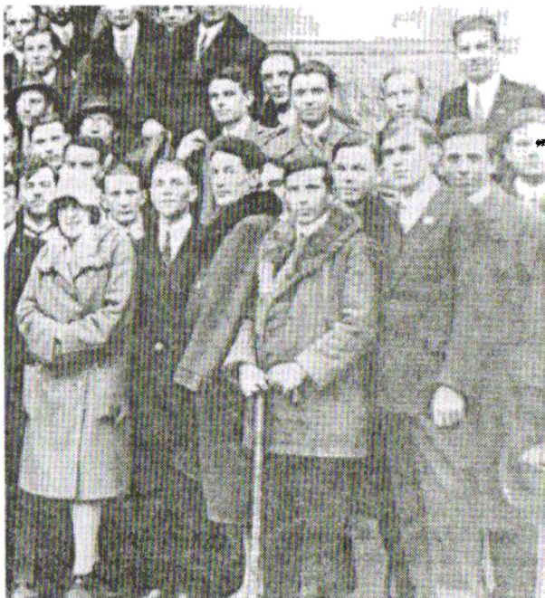
Степан Бандера (з паличкою) серед учасників II Студентського Конгресу у Львові 1931 року (фрагмент фотографії)