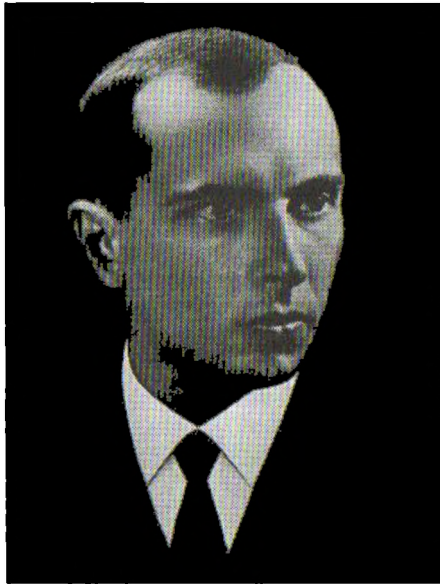
Після звільнення з Берези Картузької. Ця фотографія, малюнки з неї та дереворити Ніла Хасевича розповсюджувались під час німецької та радянської окупації

з мережею ОУН, а в Сокалі – з проводом терену. Тут він нарешті дізнається про майбутні масштаби геополітичних змін: „– стало відомо, що большевики мають зайняти більшу частину ЗУЗ на підставі договору з гітлерівською Німеччиною“ (цитата з життєпису). Абсолютний авторитет дозволяє Бандері, не займаючи жодних організаційних постів, тут же почати переорієнтацію пріоритетів мережі ОУН на боротьбу проти більшовизму.