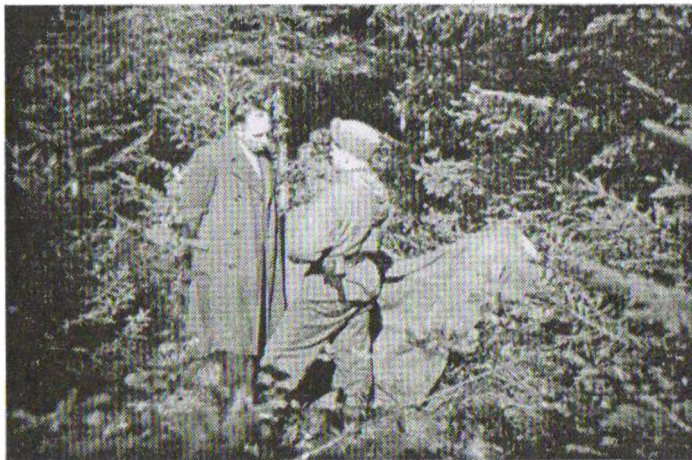
Степан Бандера розмовляє з українським повстанцем, який прибув з Краю

Поборювання націоналізму в Україні йшло за давно випробуваним сценарієм. Радянська розвідка через „двійника” в „Інтеллідженс сервіс” Кіма Філбі вклинилась в підпільну мережу націоналістів, маючи повну інформацію про кур’єрів, які йшли в Україну з дорученнями від ЗП УГВР. Відтак чекісти почали ліквідацію глибокого підпілля, закладеного Шухевичем. 5 березня 1950 року гине Шухевич, 28 листопада того ж року – „Горновий”, а наприкінці наступного – Петро „Полтава”. Про смерть Шухевича