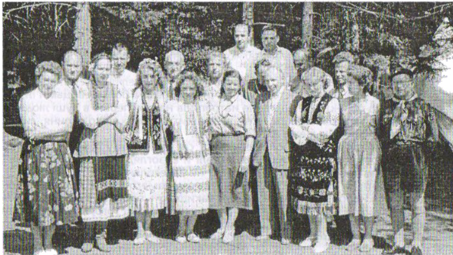
Українські емігранти на відпочинку в Баварських Альпах. Степан Бандера в центрі в першому ряду

Голова Проводу ОУН в Українських Землях, Ю. Леміш“.