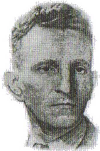
Роман Шухевич. Фото з останніх документів, якими користувався Головний Командир УПА

час, також Микола Климишин у своїх спогадах „В похіді до волі” прямо вказує на цю заборону Бандери.