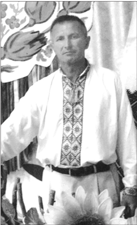
Честь українця, сина політв'язня – понад усе