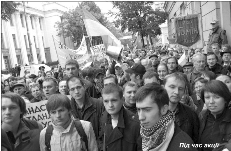
Під час акції

КМО КУН закликає українців поволі виходити з летаргічного сну, у який вони впали після поразки державницьких сил на останніх президентських виборах. Неукраїнські сили, що вчепились за владні крісла в Україні, тиснуть ще щодалі потужніше, от-