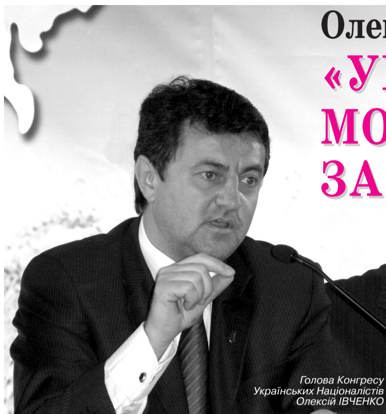
Голова Конгресу Українських Націоналістів Олексій ІВЧЕНКО