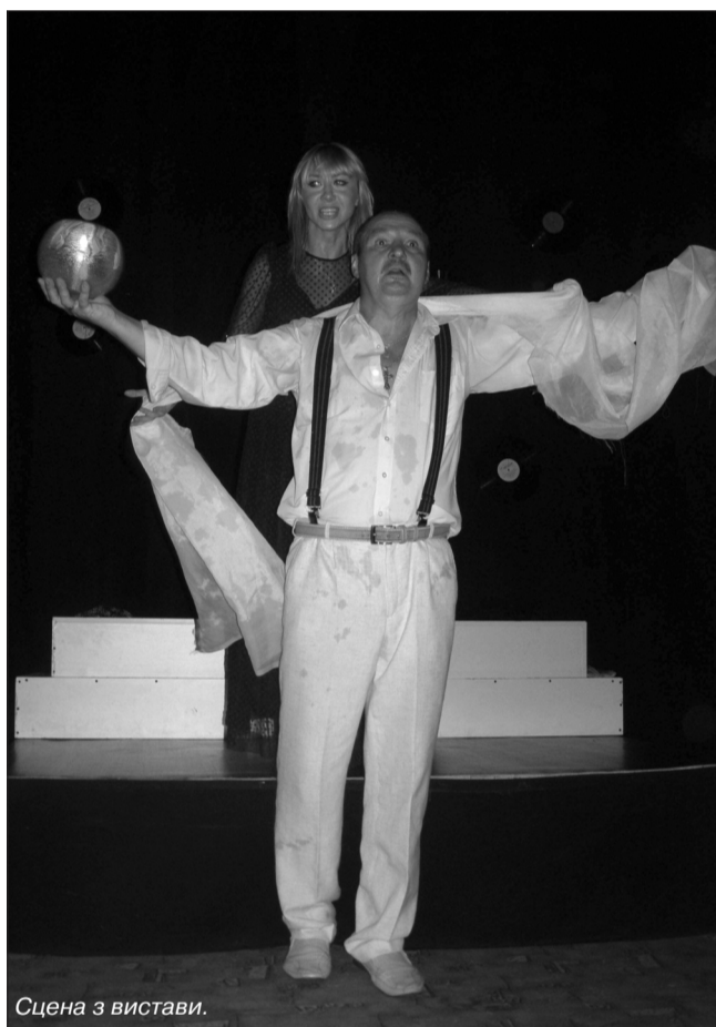
Сцена з вистави.

«Чорна рілля, або Любов і смерть Степана Бандери»