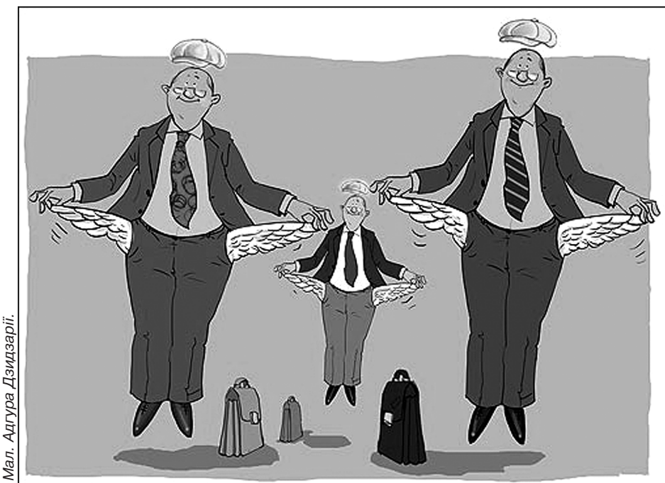
Мал. Адгуре Дзидзарї.

Загалом минулого тижня з телекранів прозвучало чимало такого, що виходить не лише за межі пристойності, а й