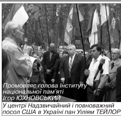
Промовляє голова Інституту національної пам'яті Ігор ЮХНОВСЬКИЙ У центрі Надзвичайний і повноважний посол США в Україні пан Уїліям ТЕЙЛОР