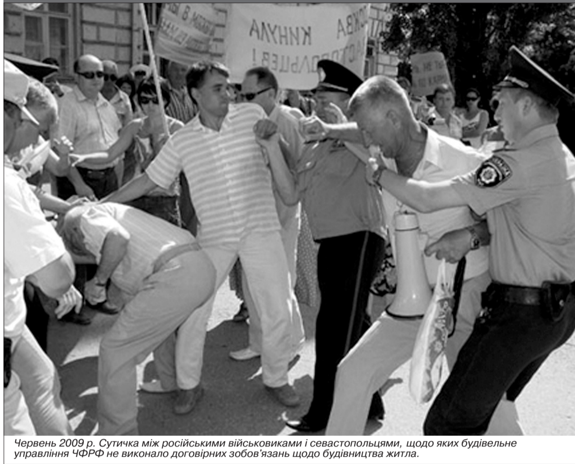
Червень 2009 р. Сутичка між російськими військовиками і севастопольцями, щодо яких будівельне управління ЧФРФ не виконало договірних зобов'язань щодо будівництва житла.

жавою, вимагав скласти в односторонньому порядку план поетапного виведення іноземних військ, то кожен раз Ви нам відповідали, що порушення цього питання не на часі, позаяк попереду ще багато років. А тут раптом таке термінове форсування нової угоди, котрої ніхто з громадян не бачив і не читав. І так поспішали, що навіть забули денонсувати договір від 1997 року. Адже Ви добре знаєте, що для того, щоб задіяти нову угоду, належить скасувати попередню, термін і юридична сила котрої сягають до 2017 року. Тепер маємо дві діючі угоди.