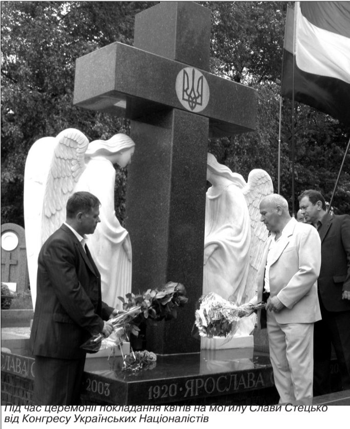
Під час церемонії покладання квітів на могилу Слави Стецько від Конгресу Українських Націоналістів

Наступним виступив экс-міністр закордонних справ Володимир Огризко: "На жаль, мені не пощастило довго співпрацювати зі Славою Стецько, – з жалем відзначив він, додавши: Але я мав одну досить тривалу бесіду зі Славою. Після розмови я відчув велич цієї людини, потужний український стрижень та залізну волю. Пані Слава йшла вперед, чітко знаючи, чого вона хоче. Саме тому вона довела свою справу до логічного кінця – української незалежності. Наша