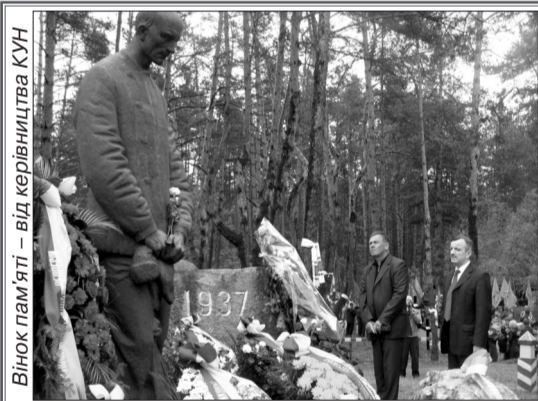
Вінок пам'яті – від керівництва КУН