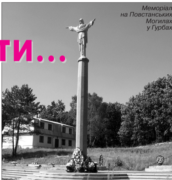
Меморіал на Повстанських Могилах у Гурбах

Бій під Гурбами був найтривалішим та найбільшим за весь час існування УПА. Відбувся він наприкінці квітня 1944 року на межі сучасних Рівненської (Здолбунівського, Дубенського та Острозького районів) та Тернопільської (Кременеччина) областей. Майже 35 тисяч добірного війська НКВС, прикордонників, охорони тилу, які входили у підпорядкування Наркомату внутрішніх справ, на боці яких була та-