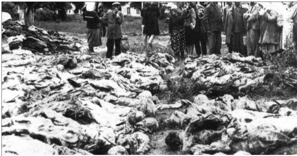
Жертви трагедії в Катинському лісі

Найтрагічнішою зупинкою на цьому шляху стала Катинь. Польські офіцери, священники, службовці, поліцейські, співробітники прикордонної охорони, тюремні працівники були знищені без процесів і вироків. Вони стали жертвами неоголошеної війни. Їхнє вбивство було скоєно з нехтуванням прав і конвенцій цивілізованого світу. Їхня гідність – як солдатів, поляків і людей – були розтоптані. Рови