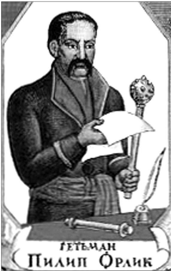
ГЕТЬМАН Пилип Орлик

До 1920 року в Україні змінилося кілька урядів і політичних устроїв (Українська держава – Гетьманат Павла Скоропадського, УНР, очолювана Директорією), кожен з яких залишив свої правові акти – кілька проектів Конституції УНР, підготовлених Директорією, Закон про тимчасовий державний устрій, виданий Скоропадським. Конституційний процес в УРСР відійшов від гарантування прав і свобод гро-