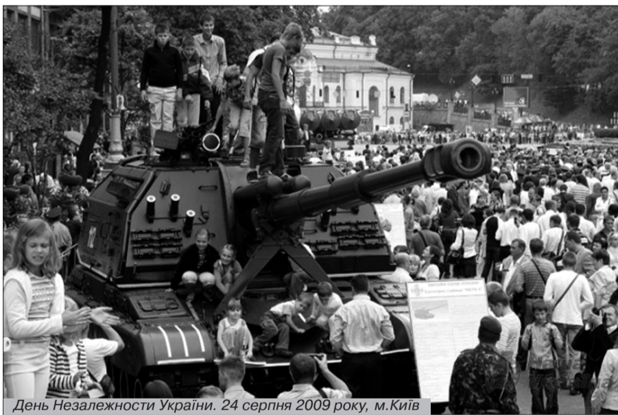
День Незалежності України. 24 серпня 2009 року, м.Київ

5–28 червня 1919 р. – проведена Чортківська наступальна операція Української Галицької Армії з метою розгрому угруповань противника в районі м.Чорткова (тепер Тернопільсь-