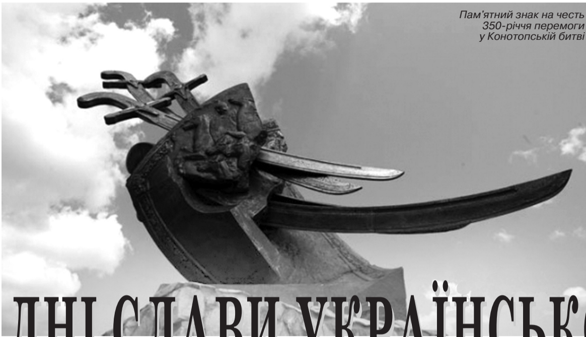
Пам'ятний знак на честь 350-річчя перемоги у Конотопській битві