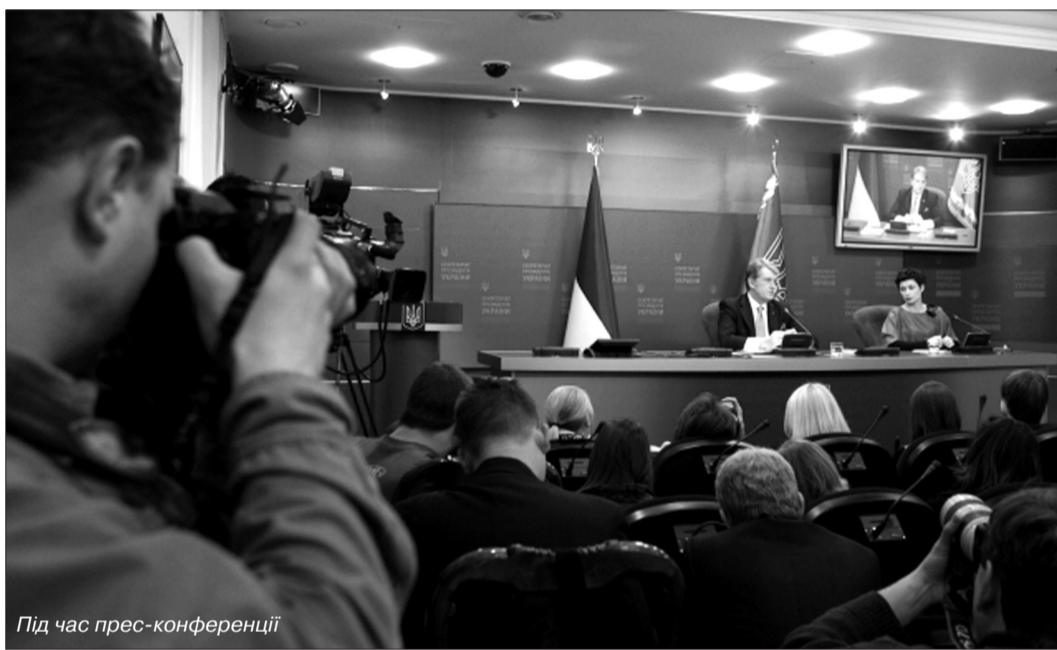
Під час прес-конференції

Коли мова йшла про перший тур, я змагався більше не з Януковичем, а з Тимошенко. Глибоко переконаний, і на сьогодні таким є, що найбільш залежною політичною фігурою є Тимошенко. Питання змагання з Януковичем – це питан-