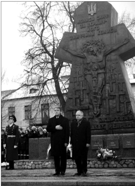
Президент України В. ЮЩЕНКО і президент Польщі Л. КАЧИНЬСЬКИЙ біля пам'ятника жертвам більшовицьких репресій у Бродях на Львівщині. Лютий 2009 року.

Після прийняття польським Сеймом літом минулого року неформальної резолюції (без голосування та офіційної публікації) з осудженням ОУН-УПА як структури, що організувала геноцид (людобуйство) поляків на "всходніх теренах РІПР – всходніх кресах), такі ж резолюції прийняли ще два воеводські сеймики – Нижньосілезького і Опольського воеводств. У цих резолюціях все перекладається з хворої го-