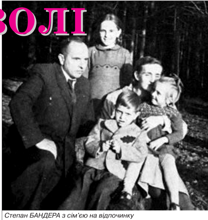
Степан БАНДЕРА з сім'єю на відпочинку

Обираючи героєм свого твору постать Степана Бандери, драматург розкриває маловідомі сторінки його біографії, а саме – потаємні почуття і стосунки з трьома коханими жінками. Але розповідь не тільки, а можливо й не стільки про це. Дія розгортається, так би мовити, у двох часових вимірах – минуле і сучас-